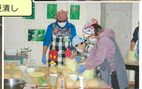
つめ「空気を入れずに」↑