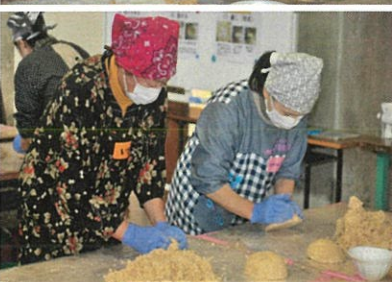
↑ こね・味噌玉作り